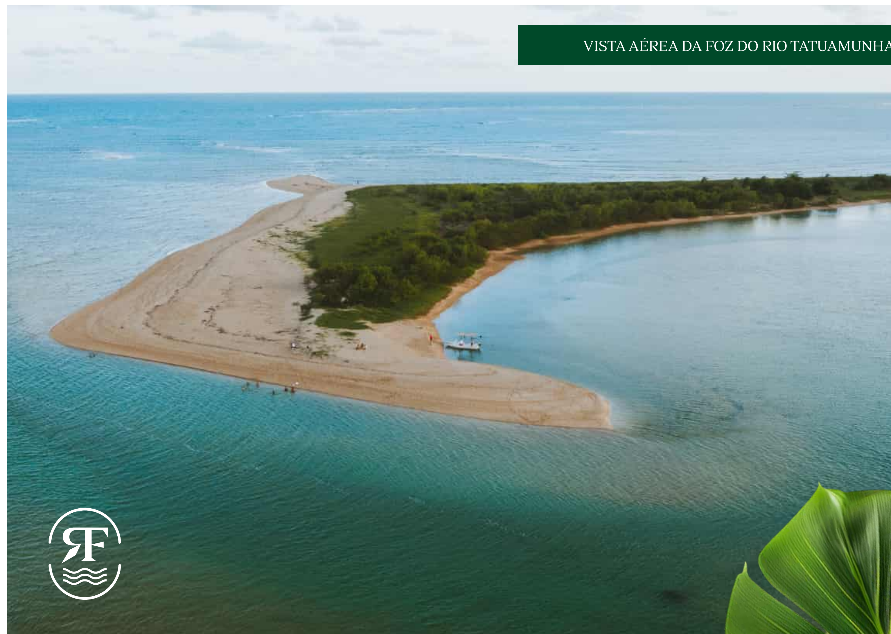
VISTA AÉREA DA FOZ DO RIO TATUAMUNHA

Ali, entre manguezais, mata atlântica e o horizonte azul, a vida se revela em seu estado mais puro.