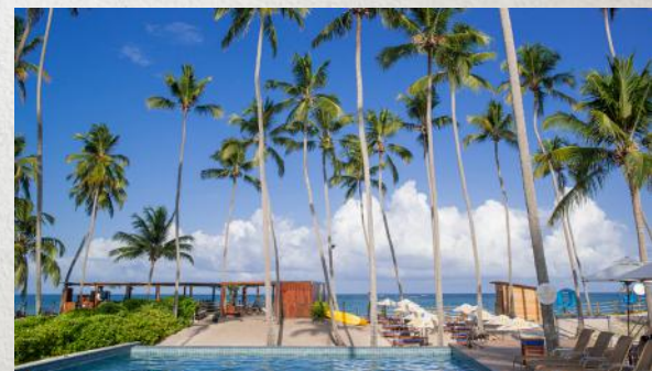
Praêro Beach Club